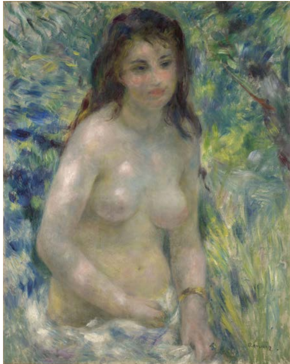
FIG. 3 Pierre-Auguste Renoir, Estudio de torso, efecto de luz solar , ca. 1874. Óleo sobre tela. Museo de Orsay, París.

consagrada del desnudo femenino (FIG. 3), Albert Wolff comentó en Le Figaro : “¡Vaya e intente explicarle al Sr. Renoir que el torso de una mujer no es una masa de carne en descomposición con manchas verdes y violáceas que indican un estado de putrefacción completa del cadáver!” 4 La queja de que los cuadros de los impresionistas, especialmente los de Gustave Caillebotte, eran demasiado azules o demasiado violetas se convirtió en un estribillo constante en la prensa. En su crítica a la tercera exposición impresionista, cuando Bertall entró a la galería, comparó la abrumadora paleta de azules y verdes con el queso azul Roquefort. 5