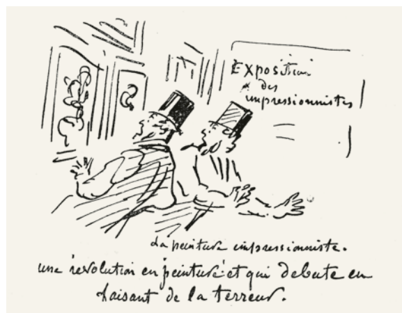
FIG. 2 Cham (Amédée Charles Henri de Noé), caricatura de la primera exposición impresionista de París, 1874. Grabado. Biblioteca Nacional, París, Francia.

Decir que las obras expuestas por los miembros fundadores del colectivo —que eran Monet, Paul Cézanne, Pierre-Auguste Renoir, Degas, Alfred Sisley, Camille Pissarro y Berthe Morisot—, conmocionaron al público, es decir poco. El ilustrador francés del siglo XIX, Cham, hizo una caricatura en respuesta a la primera exposición del colectivo en donde puso de manifiesto el aspecto revolucionario del arte, además del hecho de que habían logrado organizar una exposición de este tipo (FIG. 2). La leyenda rezaba: “Una revolución en la pintura que comienza causando terror”,